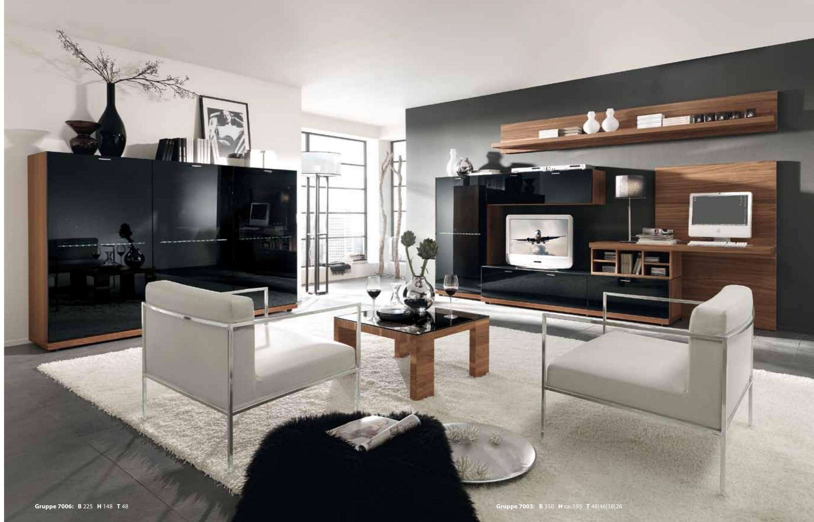
Gruppe 7006: B 225 H 148 T 48