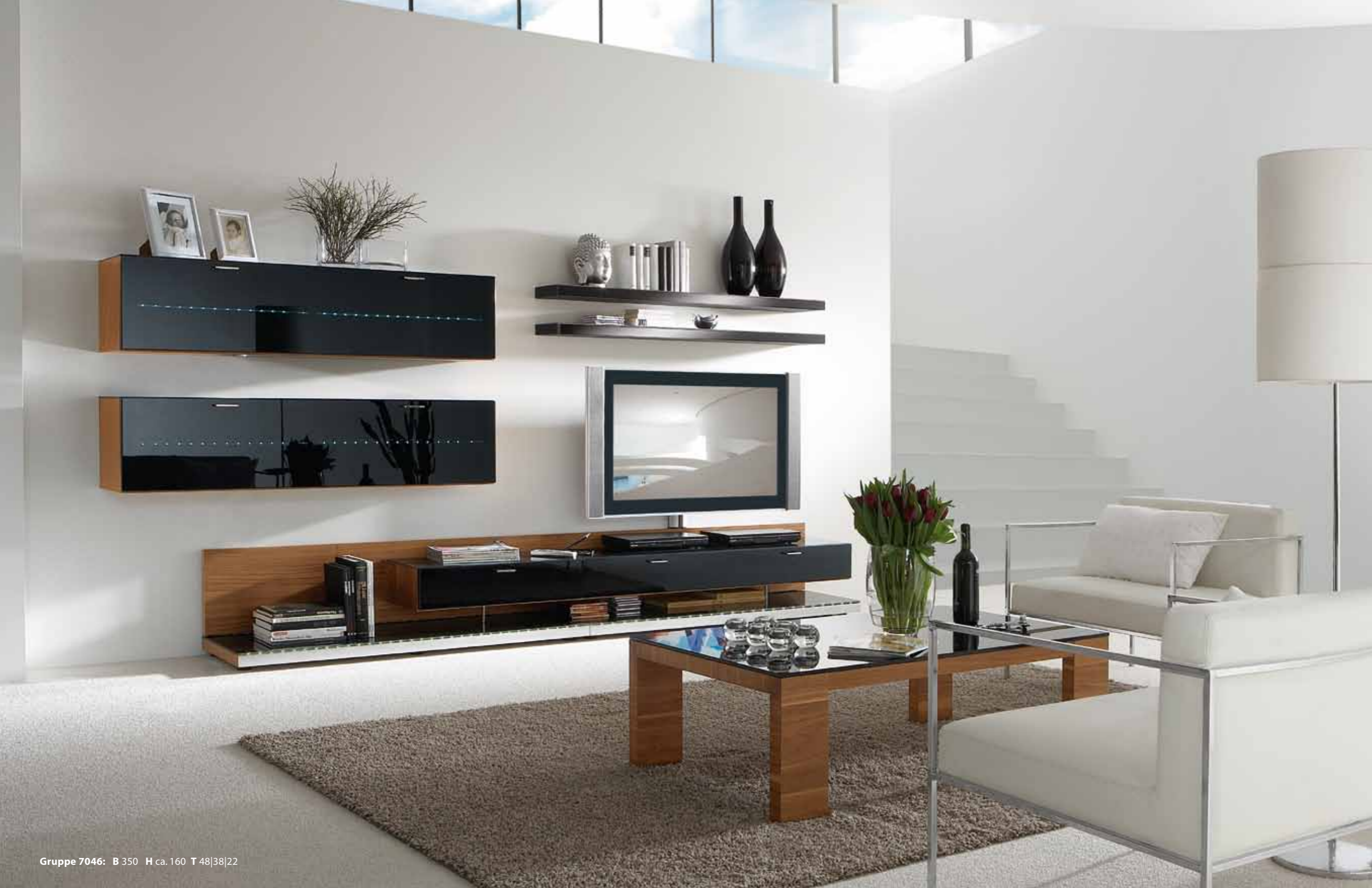
Gruppe 7046: B 350 H ca. 160 T 48|38|22