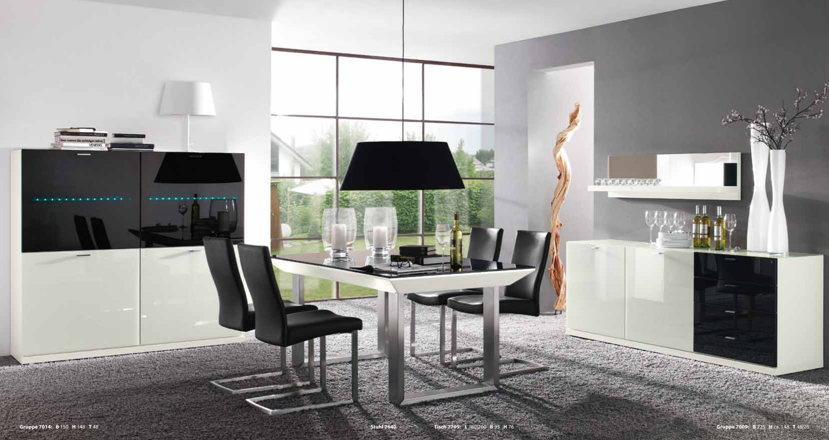
Gruppe 7014: B 150 H 148 T 48